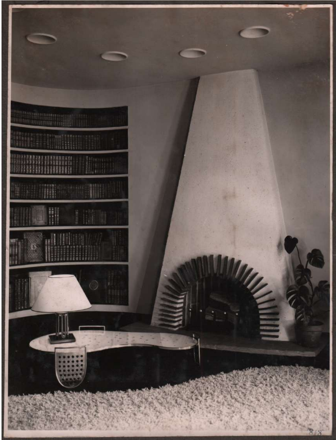
pour une lampe similaire chez Jean Royère, circa 1947.