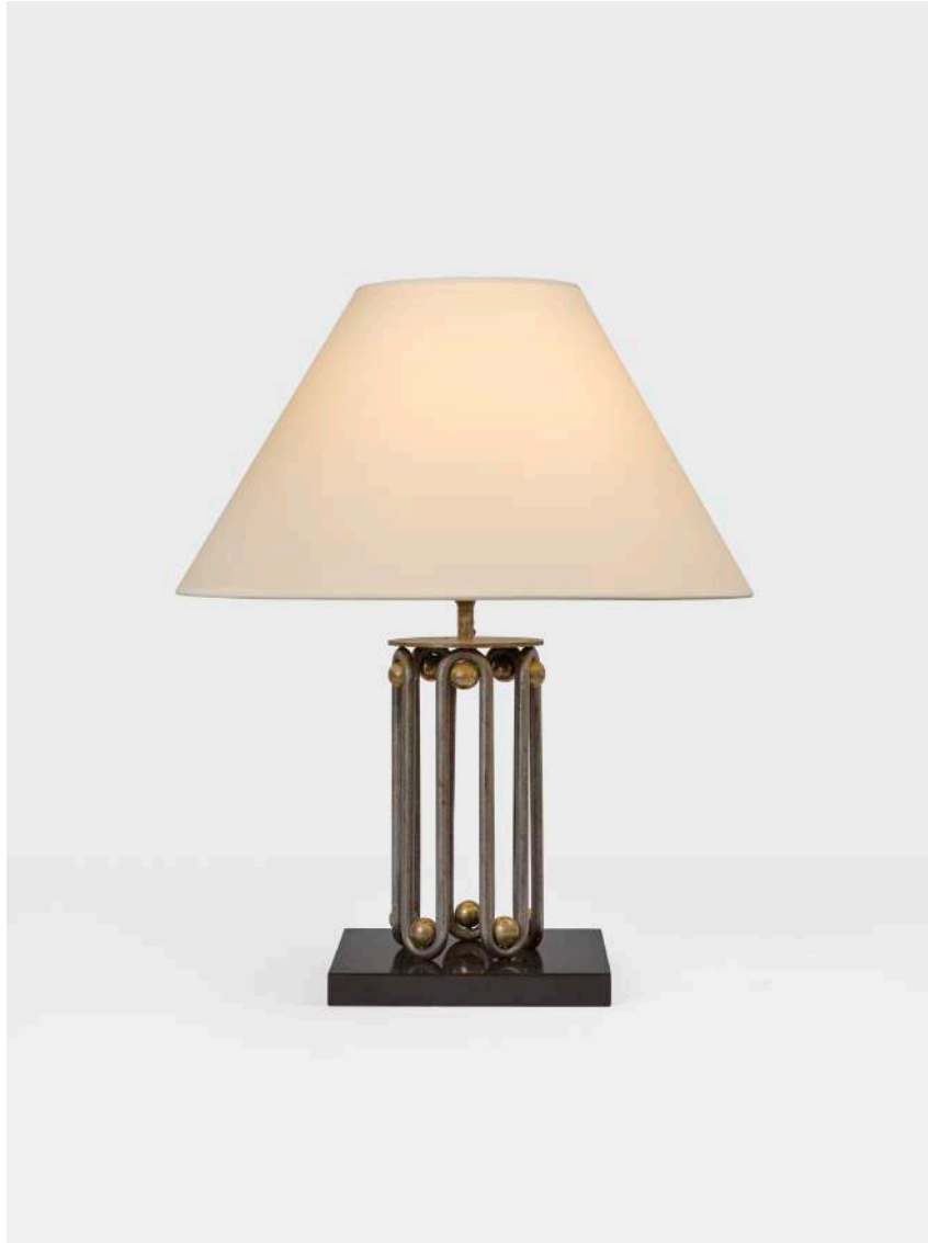
Jean ROYERE (1902-1981) Lampe Ondulations en fer patiné, laiton et marbre noir Ondulations lamp in patinated iron, brass and black marble