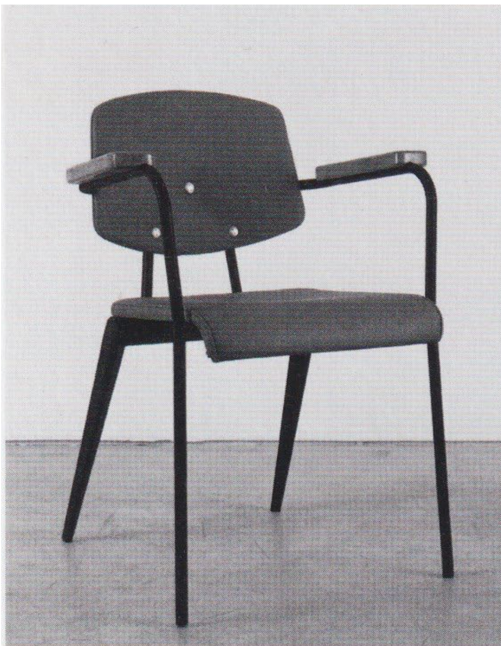
Fauteuil Conférence n° 355, 1954.